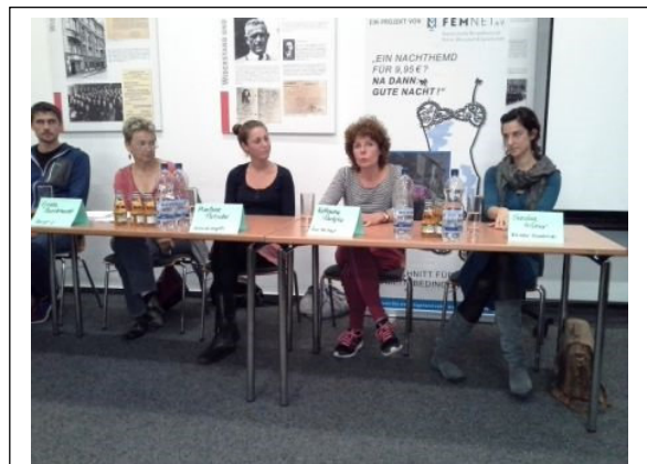
Faire Woche Bonn: Kleidung im Namen des Profits? Es geht auch anders