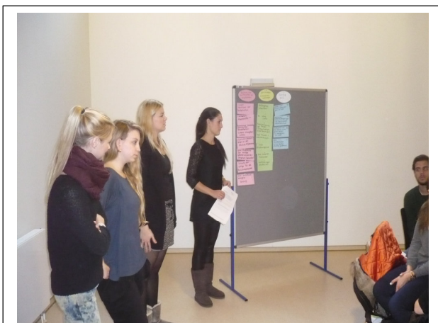
Workshop an der Akademie Mode & Design Düsseldorf

Hinsichtlich der Zusammenarbeit mit den Hochschulen war 2013 für das FairSchnitt Projekt ein sehr erfolgreiches Jahr, denn es konnten insgesamt 16 Veranstaltungen und Workshops umgesetzt werden: Die vorhandenen Kontakte zu Hochschulen wie der HS Niederrhein, der Akademie Mode & Design (AMD) Düsseldorf oder der Universität Paderborn konnten im Jahr 2013 ausgebaut werden. Darüber hinaus wurden zahlreiche weitere Hochschulen im gesamten Bundesgebiet auf das Angebot von FairSchnitt aufmerksam gemacht und verschiedene Bildungseinheiten umgesetzt.